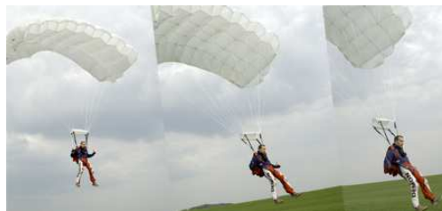
easy landing up to the smallest size of canopy