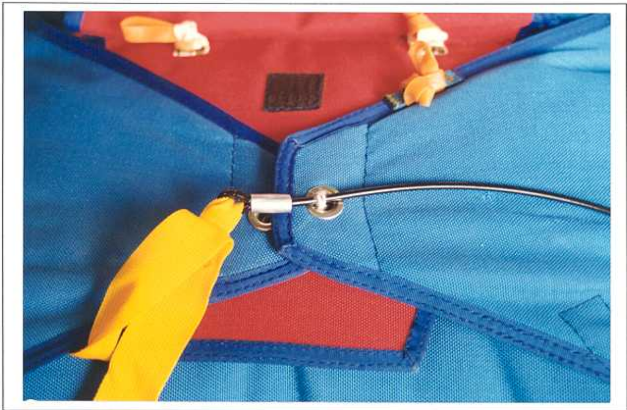
1 - SERTISSAGE CORRECTEMENT DISPOSE