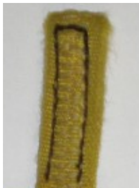
Triple « U »