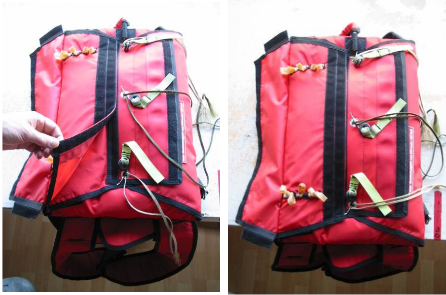
Abb. 21 a + b

Das Klappenteil wird über die linke Verschlussklappe gezogen und am Hakenband befestigt.