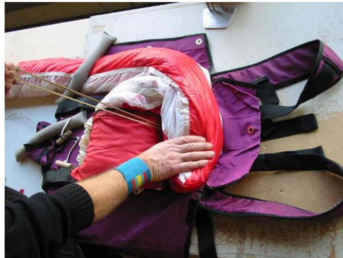
Abb. 11 S-Schlag in unterem Teil der Packhülle