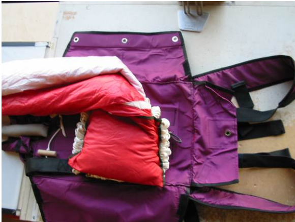
Abb. 10 Diaper in Packhülle eingelegt