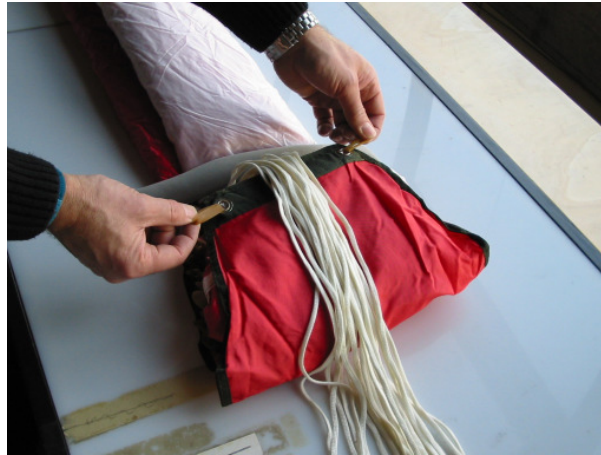
Abb. 7 Durchgezogene Packgummis

Packgummis der Verschlusschlaufen durch die Zeltösen des Diapers führen.