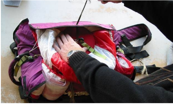
Abb. 16 Verschließen der seitlichen Ver- schlussklappe