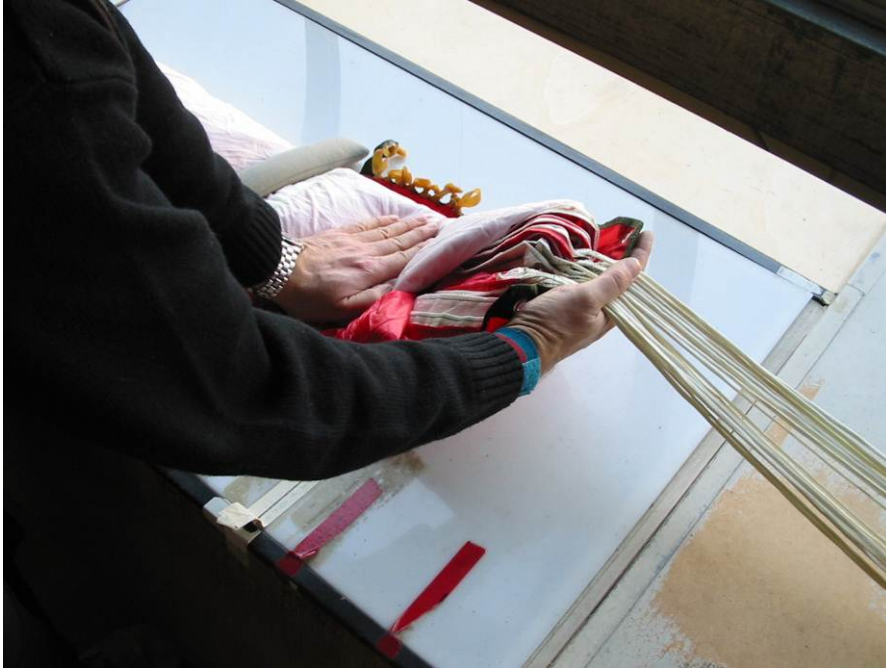
Abb. 6 Einschlagen der Basis

Basis mit Fangleinenbündel in Richtung zu Scheitel einschlagen ( Abb. 6 )