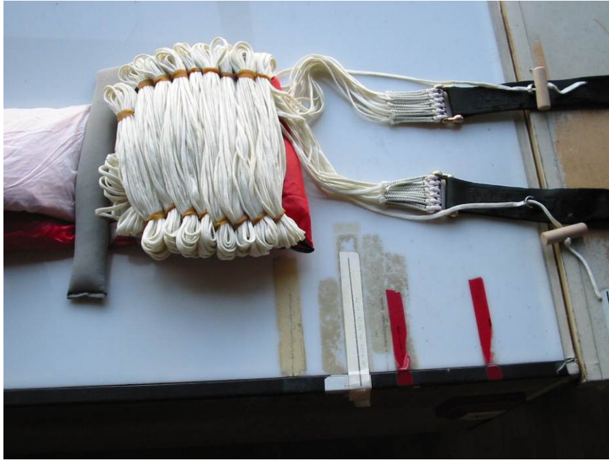
Abb. 9 Eingeschlaufte Fangleinen

Fangleinen von oben nach unten in die Packgummis am Diaper einschlaufen. Die letzten 40 cm der Fangleinen nicht einschlaufen.