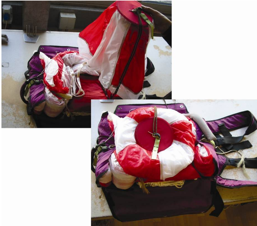
Abb. 15 Eingelegter Hilfsschirm

Hilfsschirm auf den Diaper legen, dabei kein Gewebe unter der Feder einklemmen. Hilfsschirmleine in S-Schlägen einlegen.