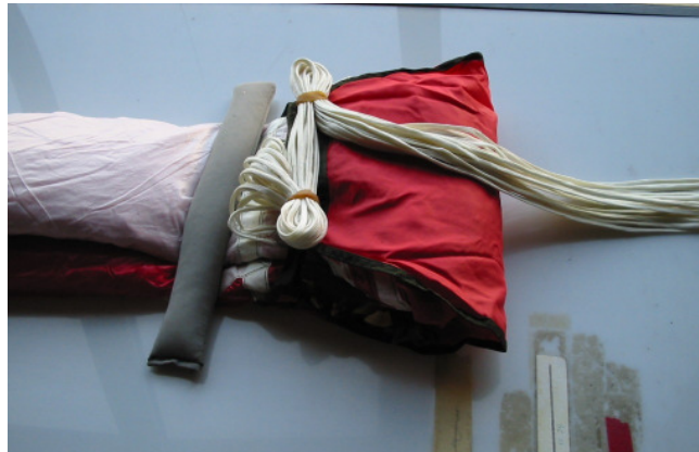
Abb. 8 Verschlossener Diaper

Diaper mit den ersten zwei Fangleinenschlägen verschließen.