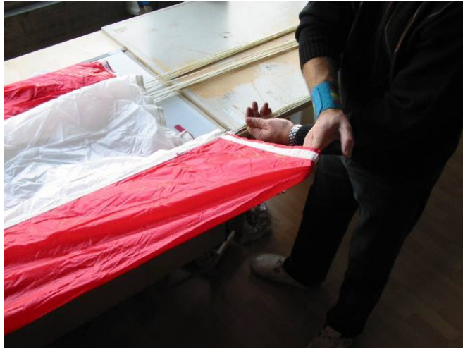
Abb.1 Legen der Bahnen