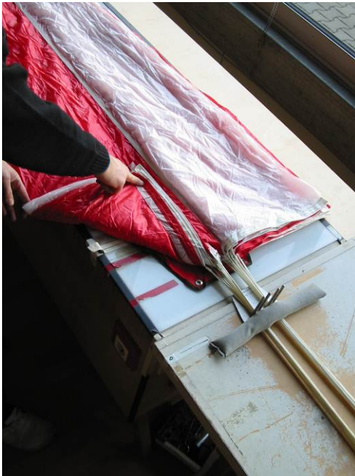
Abb. 3 Eingeschlagener Basisrand