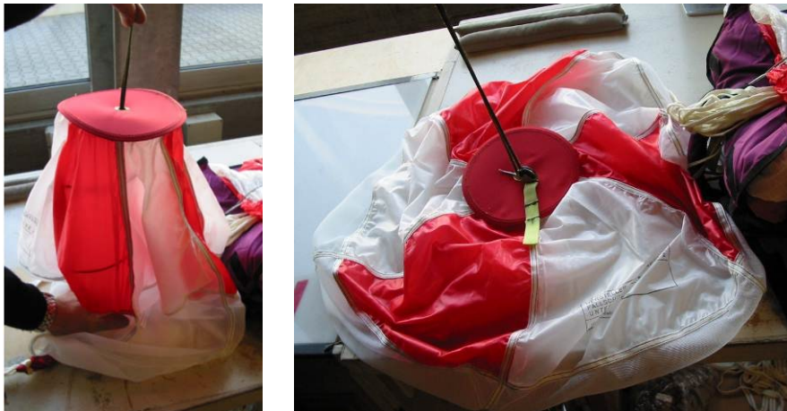
Abb. 14 Zusammgedrückter und gesicherter Hilfsschirm, kein Gewebe in der Feder einklemmen!