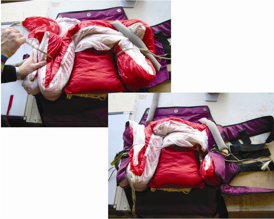
Abb. 12 Eingelegte Kappe und geschlossene Verschlussklappen

Untere Verschlussklappe schließen, mit Vorstecker sichern. Anschließend restlichen Kappenteil in S-Schlägen in den oberen Teil der Packhülle einbringen; dabei Packhilfsschnur durch obere Gummischlaufe zwischen den Kappenschlägen durchziehen. Obere Verschlussklappe schließen und mit Vorstecker sichern.