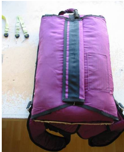
Abb. 18 Fertig verpackter Fallschirm

ACHTUNG: PACKWERKZEUG AUF VOLLSTÄNDIGKEIT ÜBERPRÜFEN