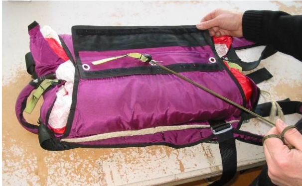
Abb. 16A Verschließen der unteren und oberen Verschlussklappe