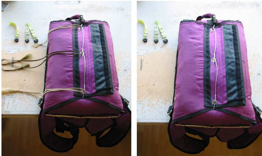
Abb. 17 Verschlussene Verpackung

Vorstecker und Hilfsleinen entfernen. Dabei Abzugskabel einbringen.