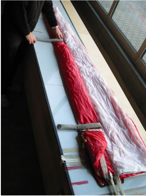
Abb. 4 Linke Kappenseite längs gefaltet

Kappe Längsfalten gemäß Abb. 4, Breite entspricht Diaperbreite.