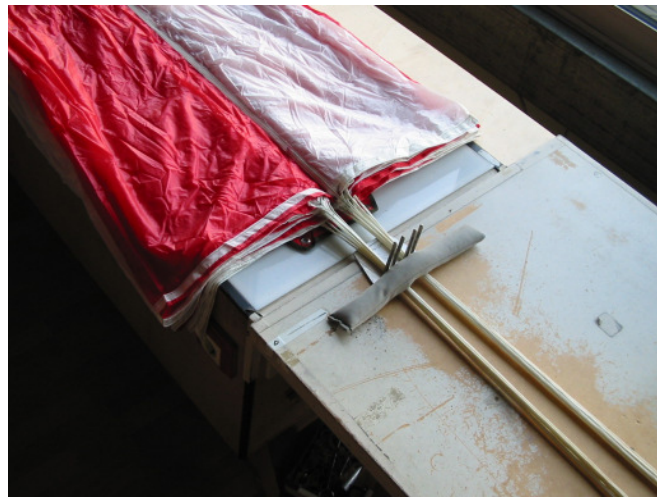
Abb. 2 Bahnen in zwei Gruppen ausgelegt