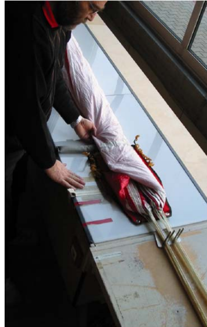
Abb. 5 Beide Kappenhälften längs gefaltet

ANMERKUNG: Beim Längsfalten der Kappe darauf achten, dass die Kappenbreite der Größe des Diapers entspricht.