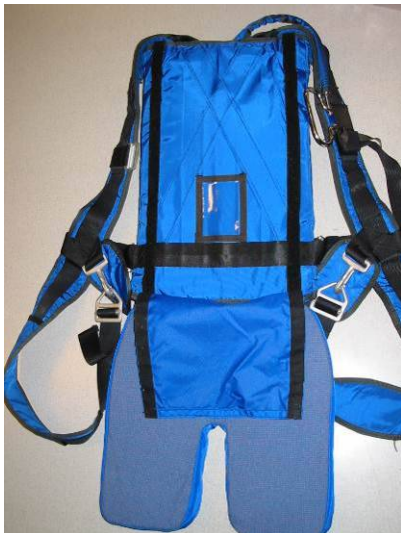
Abb. 40 Sitzkissen bündig an der Fallschirmunterkante anlegen.